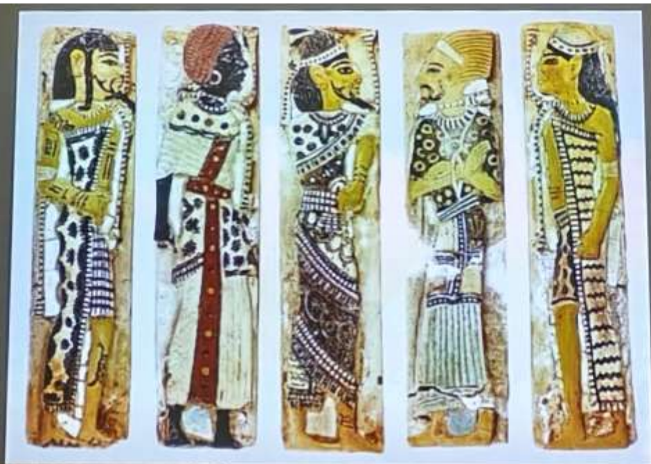
Плитка с изображением иностранцев из гробницы Рамзеса III, 12 век до н.э.